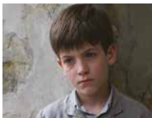
Il Primo Uomo di Gianni Amelio Italia / Francia / Algeria 2011 | 91' v. o. sott. Italiano Cast: Jacques Gamblin, Denis Podalydes, Maya Sansa, Nino Jouglet, Catherine Sola In programma: Mercoledì 9 novembre h. 20:30 - Savoy 4