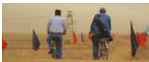
Undo di Mojed Neisi Iran 2016 | 39' v.o. sott. Ita. e Ing. In programma: Giovedì 16 novembre h. 21:30 - Savoy 4

Un'analisi spiazzante e vorticoso dei paradossi del Libano, raccontati attraverso il suono, i suoi monumenti iconici e nascondigli segreti. Lettera ad un padre sottoforma di viaggio sotterraneo nel rimosso di Beirut: una città (e una nazione) che si nutre di modernità mentre ignora ironicamente i vizi che la ostacolano nel raggiungerla.