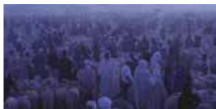
Of Sheep and Men di Karim Sayad Svizzera / Francia / Qatar 2017 | 78' v.o. sott. Ita. e Ing. In programma: Sabato 11 novembre h. 22:00 - Savoy 4

Habib ha 16 anni e sogna di diventare veterinario. Ma non avendo studiato, decide di addestrare un montone chiamato "El Bouq" per trasformarlo in un campione di lotta tra ovini. Samir di anni ne ha 42 e non ha più sogni, se non quello di sopravvivere comprando e vendendo pecore. Un potente documentario che tratteggia il rapporto complesso e viscerale che lega uomo, animale e natura.