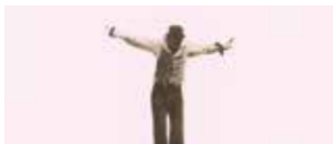
Crossing the Seventh Gate di Ali Essafi - Marocco 2017 | 80' v.o. sott. Ita. e Ing. In programma: Mercoledì 15 novembre h. 21:30 - Savoy 4

Il regista Pierpaolo Verdecchi sarà presente in sala >>> Un gruppo eterogeneo di senegalesi ha occupato una fabbrica dismessa nella periferia di Barcellona, trasformandola in una casa. Sono tutti immigrati irregolari, per loro Barcellona non è la città da cartolina che si aspettavano, ma una metropoli complessa ed escludente. Un ritratto discreto e toccante del quotidiano di una comunità di rifugiati.