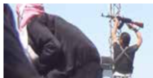
Sand and Blood di Matthias Krepp e Angelika Spangel Austria 2017 | 90' v.o. sott. Ita. e Ing. In programma: Lunedì 13 novembre h. 21:30 - Savoy 4

Vivono per strada, negli squat o nelle case. Sono ragazzi che vagano nella speranza di raccontare la loro fuga, la rinascita di un desiderio. Questo film è un incontro con Mika, Valentin, Alan ed Ana, uccelli di passaggio la cui destinazione resta sconosciuta. Con delicatezza e pudore, il regista dà voce e volto a chi vive ai margini della società.