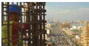
Taste of Cement di Ziad Kalthoum Germania / Libano / Qatar / Siria / Emirati Arabi Uniti 2017 | 85' v.o. sott. Ita. e Ing. In programma: Domenica 12 novembre h. 21:30 - Savoy 4

Da Gaza, striscia di terra incuneata tra Israele e l'Egitto e isolata dal resto del mondo, nulla entra e nulla esce. O quasi: 40 tavole da surf sono state introdotte nel paese negli ultimi dieci anni ed è nato così un piccolo – ma importante – movimento di giovani surfisti della Striscia. Quando la speranza, lo sport e la forza delle onde vincono ogni tristezza e desolazione.