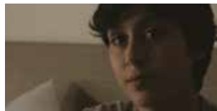
Birds of Passage di Adrien Charnot Francia 2017 | 60' v.o. sott. Ita. e Ing. In programma: Lunedì 13 novembre h. 19:30 - Savoy 4

Gli operai siriani di Beirut costruiscono grattacieli. Il loro unico contatto con il mondo esterno è un varco nel sottosuolo. Strappati dal loro paese, dove la guerra non è finita, si riuniscono di notte per avere notizie dalla propria terra, sperando in una vita migliore. Come si fa a costruire quando il mondo è in rovina? La fatica del lavoro e la tragedia dell'attesa in un film verticale e lacerante.