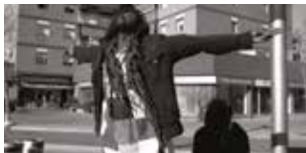
Babylonia mon amour di Pierpaolo Verdecchi Italia / Spagna 2017 | 72' v.o. sott. Ita. e Ing. In programma: Martedì 14 novembre h. 21:30 - Savoy 4

Il regista Pierpaolo Verdecchi sarà presente in sala >>> Un gruppo eterogeneo di senegalesi ha occupato una fabbrica dismessa nella periferia di Barcellona, trasformandola in una casa. Sono tutti immigrati irregolari, per loro Barcellona non è la città da cartolina che si aspettavano, ma una metropoli complessa ed escludente. Un ritratto discreto e toccante del quotidiano di una comunità di rifugiati.