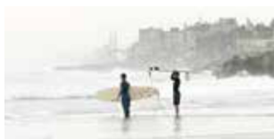
Gaza Surf Club di Philip Gnadet e Mickey Yamine Germania 2016 | 87' v.o. sott. Ita. e Ing. In programma: Domenica 12 novembre h. 19:30 - Savoy 4

Habib ha 16 anni e sogna di diventare veterinario. Ma non avendo studiato, decide di addestrare un montone chiamato "El Bouq" per trasformarlo in un campione di lotta tra ovini. Samir di anni ne ha 42 e non ha più sogni, se non quello di sopravvivere comprando e vendendo pecore. Un potente documentario che tratteggia il rapporto complesso e viscerale che lega uomo, animale e natura.