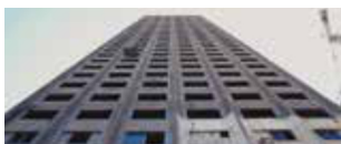
Panoptic di Rana Eid Libano / Emirati Arabi Uniti 2017 | 71' v.o. sott. Ita. e Ing. In programma: Giovedì 16 novembre h. 21:30 - Savoy 4

Da uno dei più importanti documentaristi del Marocco, un intenso ritratto di Ahmed Bouanani, regista, poeta e scrittore che ha segnato la storia del cinema marocchino grazie ad un solo film e quella della letteratura con appena due raccolte di poesie. Un libero ed appassionato viaggio nella memoria del grande intellettuale marocchino.