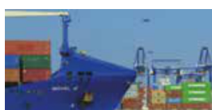
Athens Rhapsody di Antoine Danis Francia / Grecia 2016 | 81' v.o. sott. Ita. e Ing. In programma: Martedì 14 novembre h. 19:30 - Savoy 4

I fatti che hanno segnato la storia recente dell'Iraq e della Siria raccontati dalle persone giunte in Europa. Un film che si compone interamente di materiale video pubblicato su internet, filmato da attivisti, combattenti e civili. I protagonisti commentano il materiale e parlano apertamente delle loro esperienze. Un montaggio di inquietanti immagini di devastazione, paura e odio.